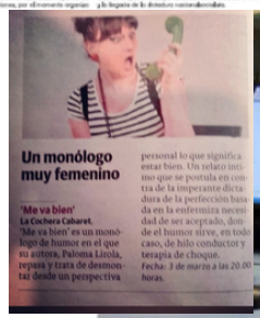
Un monólogo muy femenino