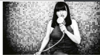
La artista malagueña Paloma Lirio.